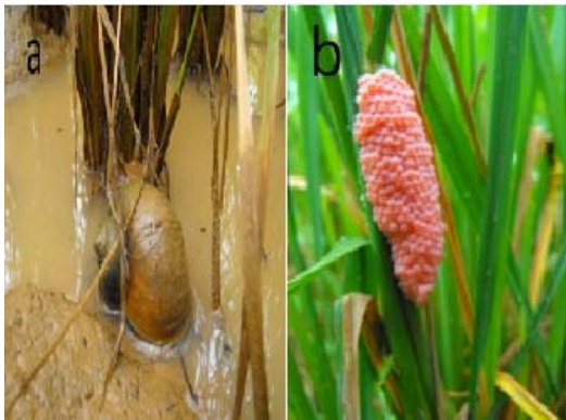
a ตัวเต็มวัยหอยเชอริ

หอยเชอริเป็นศัตรูสำคัญของข้าวในระยะหลังหวาน ชอบกัดกินต้นข้าวอ่อนๆ ระยะกล้าจนถึงแตกกอ ในช่วงเช้าและเย็น โดยจะกัดกินลำต้นข้าวใต้ผิวน้ำสูงเหนือระดับโคนต้น 0.5-1 นิ้ว และกินส่วนใบที่ลอยน้ำต่อไปจนหมดต้น พบระบาดมากในนาข้าวทั่วประเทศ โดยเฉพาะนาข้าวที่มีน้ำขัง