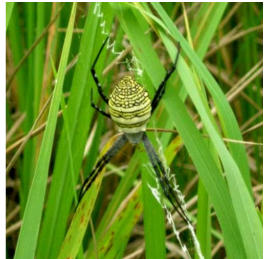
แมงมุมหลังเงิน

แมงมุมหลังเงิน เป็นตัวห้ำของผีเสื้อหนอนชอนคอหรือผีเสื้อตัวเล็กๆ ทำลายเหยื่อโดย ชักใยกลมเล็กๆในแนวตั้งระหว่างกอข้าว เพื่อดักเหยื่อ เพศเมียสร้างใยเป็นรูปวงกลม เพศผู้สร้างใยเป็นรูปสามเหลี่ยม บางครั้งจะพบเพศผู้และเพศเมียอยู่ในใยเดียวกัน และยังมีรังไข่สีน้ำตาลมีลักษณะค่อนข้างแบน ยาวเรียว หัวและท้ายแหลม แขนงติดอยู่กับใยกลม ไข่ 1 รัง จะมีไข่ประมาณ 900 ฟอง เมื่อใยถูกกระทบกระเทือนแรงๆ แมงมุมจะทิ้งตัวลงข้างล่าง เหยื่อ ได้แก่ แมลงที่บินมาติดใย เช่น ตั๊กแตน แมลงสิง บางครั้งพบแมลงปอเข็มติดใยด้วยเช่นกัน เมื่อมีเหยื่อติดใย แมงมุมจะวิ่งมาที่เหยื่อและใช้ใยพันตัวเหยื่อและดูดกิน พบทั่วไปในนาข้าวและบริเวณคันนา โดยเฉพาะระยะข้าวแตกกอเต็มที่จะพบมาก ชอบอยู่ในที่อากาศค่อนข้างแห้ง