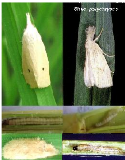
ตัวเต็มวัย ตัวหนอน และไข่ของหนอนกอสีคราม และหนอนกอแถบลาย

หนอนกอข้าวทั้ง 4 ชนิด ทำลายข้าวลักษณะเดียวกัน โดยภายหลังตัวหนอนฟักจากไข่จะเจาะเข้าทำลายกาบใบ ทำให้กาบใบมีสีเหลืองหรือน้ำตาล ซึ่งจะเป็นอาการซ้ำๆ โดยจะพบการทำลายหลังจากหวานข้าวแล้วประมาณ 1 เดือนเป็นต้นไป เมื่อฉีกกาบใบดูจะพบตัวหนอน เมื่อหนอนโตขึ้นจะเข้ากัดกินส่วนของลำต้น ทำให้เกิดอาการใบเหี่ยวในระยะแรก ใบและยอดที่ถูกทำลายจะเหลืองในระยะต่อมา ซึ่งการทำลายในระยะข้าวแตกกอนี้ ทำให้เกิดอาการ "ยอดเหี่ยว" ถ้าหนอนเข้าทำลายในระยะข้าวตั้งท้องหรือหลังจากข้าวออกรวงจะทำให้เมล็ดข้าวลีบทั้งรวง รวงข้าวมีสีขาวเรียกอาการนี้ว่า "ข้าวหัวหงอก"